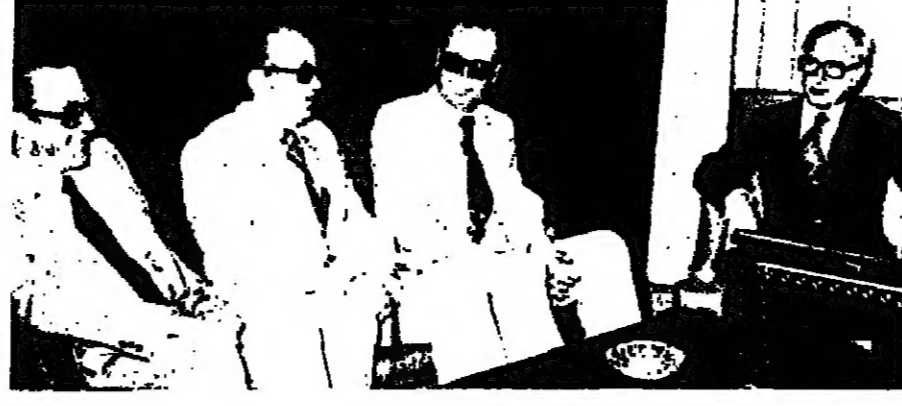
الحص: جمعاً بلجنة الإسكان